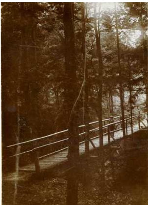
„Partie im Walde“ 1905

Wenn der Wanderer von der Burg Nordeck aus den Weg durch den Wald in Richtung „Dreihäuser Kreuz“ nimmt und z. B. den Wegmarkierungen „Allendorfer Rundweg“ folgt, um zur Schutzhütte auf der „Hohen Eiche“ zu gelangen, wird er auf seinem Wege eine Brückenkonstruktion überschreiten, die auf einer Länge von 18 Metern und in 7 Metern Höhe über den Weingraben verläuft und der der Volksmund den Namen „Teufelsbrücke“ gegeben hat. Über das Brückenbauwerk führt nicht nur der Allendorfer Rundweg sondern auch der Marburger Weg, der OHGV – Rundweg und der Kunstweg Hessen.