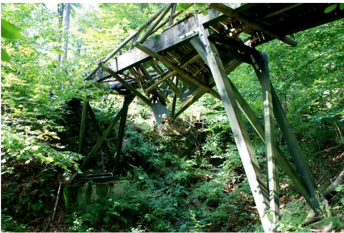
Die Teufelsbrücke nach Kyrill 2007

Mitte der 80iger Jahre des vergangenen Jahrhunderts stand aus Sicherheitsgründen bereits wieder eine komplette Erneuerung der Brücke an . Bei diesem großen Projekt erhielt man sogar Unterstützung durch Soldaten der Bundeswehr, da die Allendorfer Feuerwehr damals eine Partnerschaft mit einer Marburger Bundeswehreinheit pflegte. Die Pioniere der Einheit gossen damals für die neue Brückenkonstruktion solide Fundamente aus Beton .