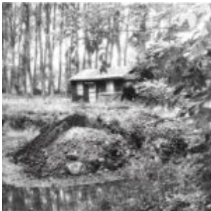
Das Gelände im Jahr 1982

Der Traum vom eigenen Vereinsheim erfüllt sich 1982 : Der OHGV übernimmt das Alte Schwimmbad an der Salzböde und baut dort nach und nach die OHGV-Hütte auf.