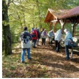
Rast am Rimbergturm