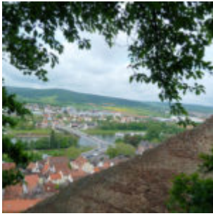
Blick auf Klingenberg